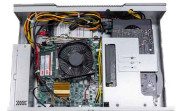
AIEdge-X300 内部 (P2200 取付済み)